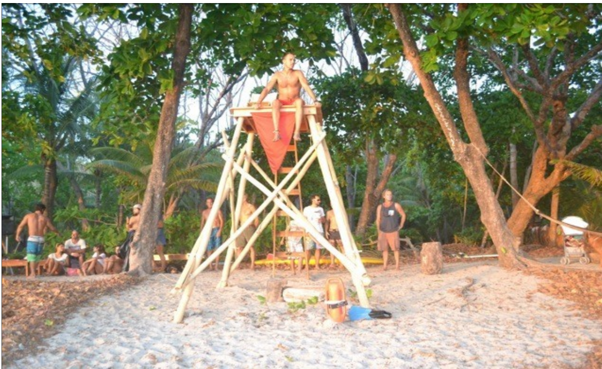
Four towers are now in steady operation on weekends at Playa Carmen, Playa Zeneidas, Casa Cecilia and Playa Hermosa

More information and Volunteer Opportunities www.santateresalifeguards.org